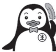
更生保護マスコットキャラクター 「ホゴちゃん」