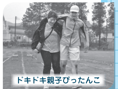
ドキドキ親子びったんこ