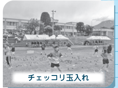
チェックリ玉入れ