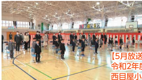
【5月放送】 令和2年度 西目屋小学校入学式

西目屋テレビでは、月に1番組から3番組程度、新しい番組を追加し放送していますので、是非ご覧ください。