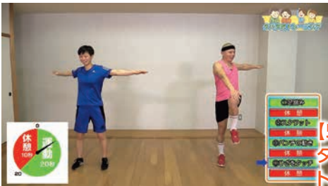
【5月放送】 タバタ式 トレーニング