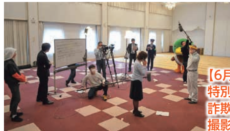
【6月放送予定】 特別定額給付金 詐欺被害防止 撮影風景