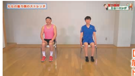
【5月放送】 筋力維持 トレーニング