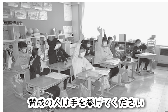
賛成の人は手を挙げてください

また、Zoomで校長室と各教室とを繋ぎ、2月9日には上学年を対象とした校長による読み聞かせを、2月15日には全校集会を行いました。いつもと雰囲気の違う教育活動にもかかわらず、児童は、落ち着いて校長の話を聞いていました。