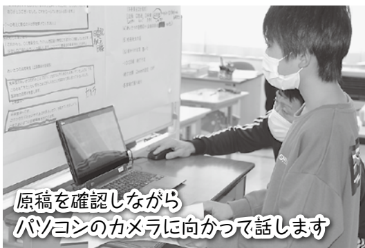
原稿を確認しながら パソコンのカメラに向かって話します