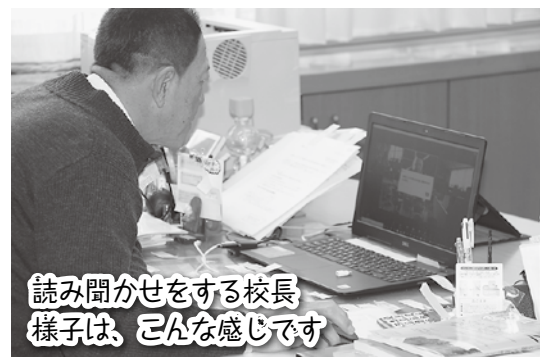
読み聞かせをする校長 様子は、こんな感じです

2月中旬現在、まん延防止等重点措置が発令されていましたが、どのようにすれば教育活動のねらいを変えることなく、安全・安心な環境で児童を育てることができるのかを常に考えています。児童にとっては多少我慢せざるを得ない日々が続くかもしれませんが、これからも、実施方法を工夫しながら、着実に子どもたちを育てていきます。