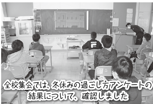
全校集会では、冬休みの過ごし方アンケートの 結果について、確認しました

また、Zoomで校長室と各教室とを繋ぎ、2月9日には上学年を対象とした校長による読み聞かせを、2月15日には全校集会を行いました。いつもと雰囲気の違う教育活動にもかかわらず、児童は、落ち着いて校長の話を聞いていました。