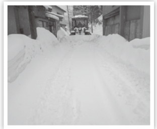
村道村元2号線の除雪状況▶