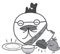
もったいない・あおもり県民運動 キャラクター「エッコー」