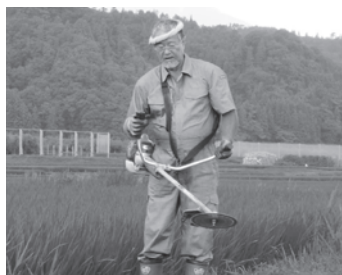
田代にある(幾三田んぼ)での草刈りの姿もさまになっています。とにかく、作業服姿がこれほど似合う歌手は他にいませんね!