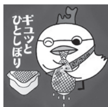
もったいない・あおもり県民運動 キャラクター「エッコー」

生ごみの重さのうち約8割は水分となっています。きちんと水気をしぼってからごみに出せば、ごみの重量を減らせるだけでなく、生ごみを燃やす際のエネルギーも節約できます。水切りネットや水気をしぼるための器具を活用しましょう。