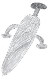
食育キャラクター グッと賞 きののにんじん 作者: 成田 歩夢

また、外から帰ったら手洗い、うがいをする、しっかりと睡眠をとることも風邪予防には大切です。風邪に負けずに寒い冬を元気に過ごしましょう！