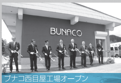
ブナコ西目屋工場オープン

体験工房やカフェも併設していることに加え、JR東日本豪華クルーズトレイン「トランススイート四季島」冬の弘前コースへ組み込まれました。内容は、職人たちの熟練の技を間近で見学、製作を体験するコースとなっております。また、ブナコの優れた特性を生かした製品は「四季島」「リゾートしらかみ撫編成」に採用しています。