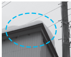
屋根の積雪による影響