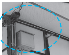
ご家庭の引込線最末端