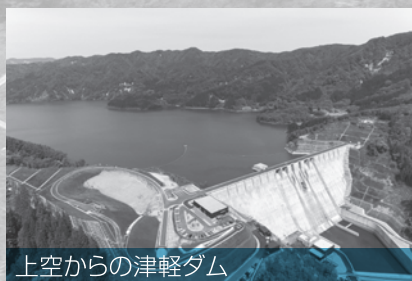
上空からの津軽ダム

「津軽ダム」は、世界自然遺産白神山地のふもとに建設された多目的ダムです。世界自然遺産がある地域で、国直轄の巨大な公共事業が行われ完成したわけですが、人類共通の「遺産として残していかなければならない自然」と社会上「必要な公共物」の共存というのは、人間の営みを続ける上で避けて通れない問題です。「世界遺産と水源の里」と名乗ることができるのは全国で私どもしかないと考えていますので、西目屋村は、その共存の姿の象徴にならないとと考えています。