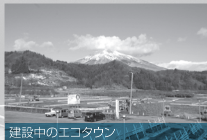
建設中のエコタウン

この試みが、国に認められ「バイオマス産業都市」の認定を受け、特に地方活性化の意義からも、この度の認定は重要であり、村の政策が国に認められたこととなります。