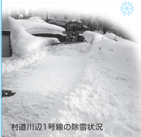
村道川辺1号線の除雪状況