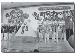
▲迫力の「ジャンボおにぎり」

常盤小学校体育館、藤崎町農業者トレーニングセンター、常盤生涯学習文化会館、常盤ふるさと資料館あすか他