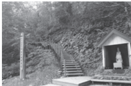
世界遺産の径(みち)ブナ林散策道

さらにレストランもテラス席を設置し、新しいメニューも増加しておりますので、アクアグリーンビレッジANMONレストランにも是非お立ち寄り下さいませ。スタッフ一同お待ちしております。