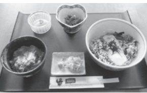
ブナの径(みち)ランチ 1,200円