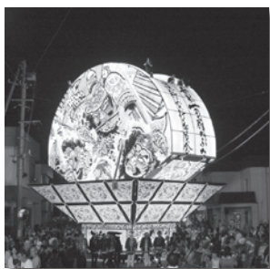
▲高さ11mの世界一の 扇ねぶたまも出陣します